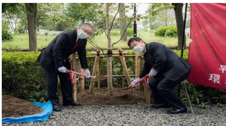
左：栗原教授<学科主任>、右：川崎環境資源工学会会長